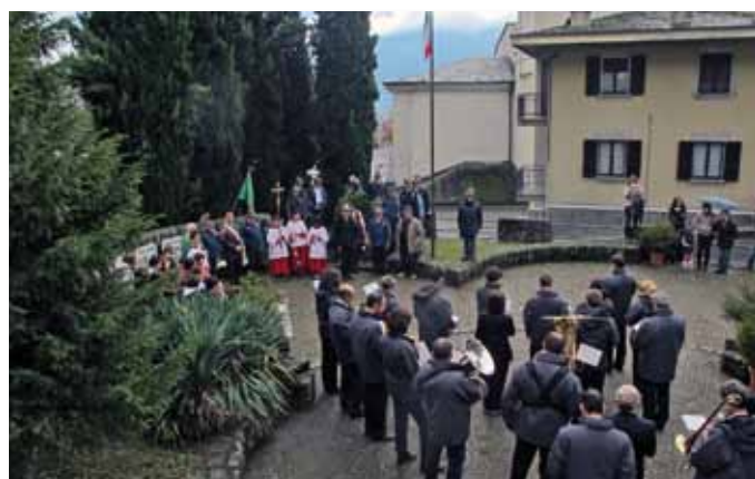
Momenti della celebrazione commemorativa del 4 Novembre a Castione