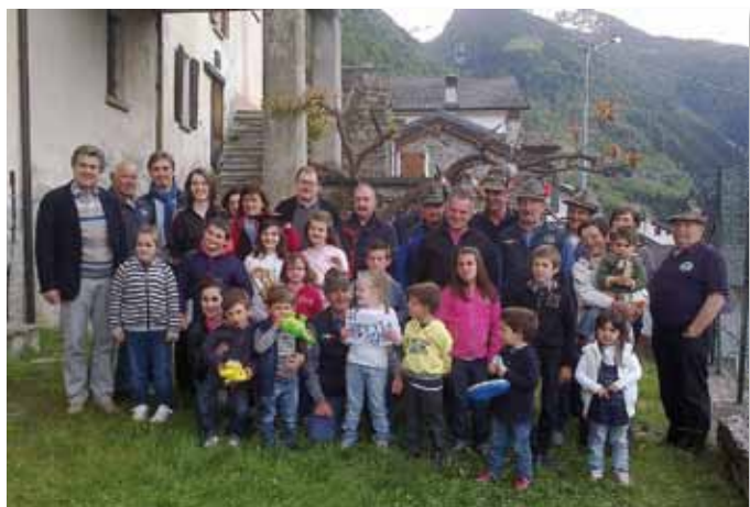
Il gioioso incontro dei bimbi con gli alpini di Tartano

Domenica 11 agosto, in località La Piana in Val lunga, si è tenuto l'abituale raduno del Gruppo che quest'anno festeggia anche il 30° anniversario della fondazione, dal 1983 con l'unione dei Gruppi di Campo e Tartano. I gagliardetti rappresentanti la Sezione di Sondrio erano circa una ventina con la partecipazione ormai abituale del Gruppo Alpini di Valdobbiate-Treviso – (amicizia nata anni fa, quando portarono il loro aiuto dopo i disastri che provocò l'alluvione del 1987).