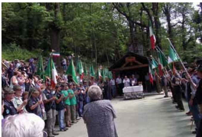
L'impeccabile e partecipato al Raduno del Cagnello