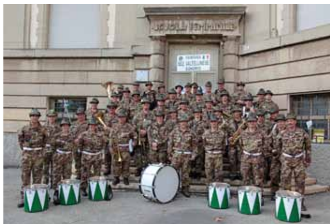
Appuntamenti significativi e gratificanti per la Fanfara al primo anno.