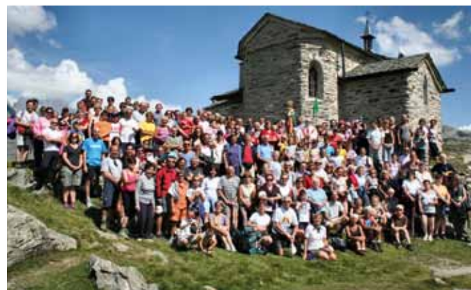
Ancora in prima fila alpini e volontari al Prabello