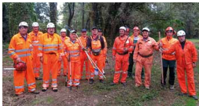
L’efficace lavoro operato dai volontari di PC a Palazzolo sull’Oglio