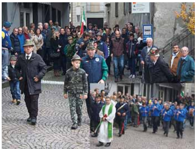
La celebrazione del 4 Novembre a Berbenno