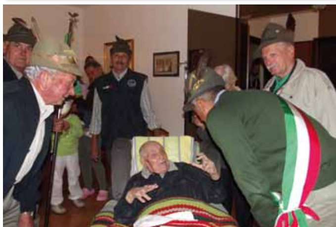
Festeggiamenti in casa Vedani a Chiavenna