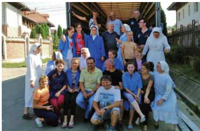
Trasferta rumena per i generosi volontari di Albaredo e Giussano

La tenerezza l'abbiamo scoperta nella vita quotidiana delle suore che mettono a disposizione tutte sé stesse per il prossimo. Inoltre l'abbiamo conosciuta in quella popolazione rumena che ci ha aperto la loro casa, spesso costruita con mattoni di fango e paglia ricoperta di amianto, con un volto che sembrava dire: “questa è la mia umile casa, senza acqua potabile, senza un sistema di riscaldamento efficiente, senza nessun comfort, con il cavallo e la carretta come unico mezzo di trasporto, ma noi siamo felici di quel poco che abbiamo” .