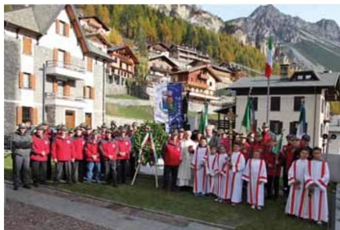
Cerimonia intensa a Isolaccia