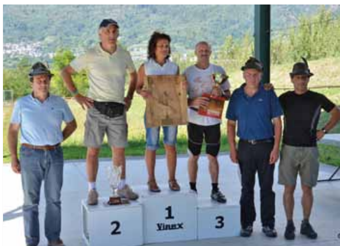
Le premiazioni con il Trofeo degli Alpini, opera di Tarcisio Serafini di Castione.