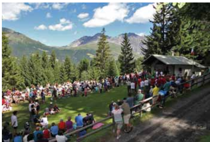
Puntuale il Raduno a Prescedont