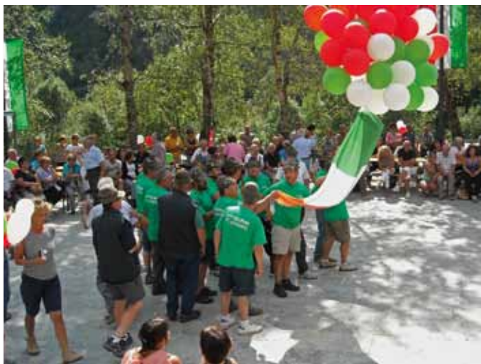
Penne nere attive in Valmasino; il 40° è coinciso con significativi interventi nella comunità.