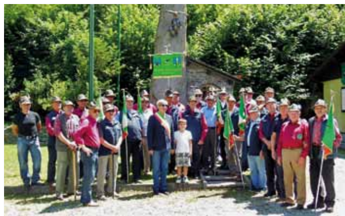
Momenti della 39° edizione della festa popolare in Ponchiera

Al "sciogliete le righe", tutti sotto il tendone per una bicchierata in compagnia e poi a tavola, per il consueto "rancio alpino", a base di pizzoccheri, polenta, salsicce, dolce, caffè e anche vino. A tutti un arrivederci alla 40° edizione!