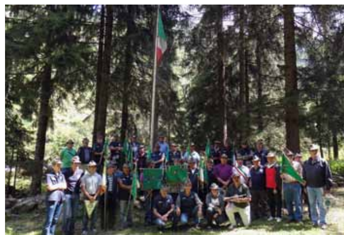
Il Raduno del 30° in Val Lunga