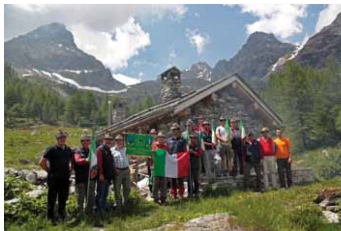
Bella manifestazione alpina al Lagazuolo.