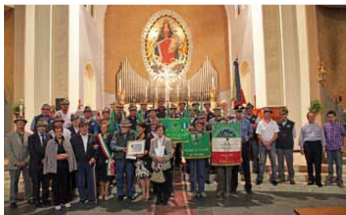
Significativa e commovente la cerimonia tenutasi davanti al Monumento degli Alpini, accanto alla statua di un benedicevole Beato Don Carlo Gnocchi e la S. Messa officiata da don Alfonso Rossi nel Santuario degli Alpini.