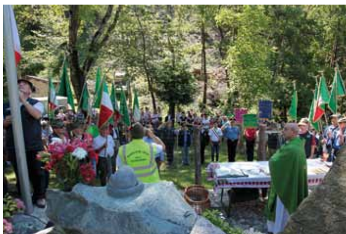
Immagini del bel raduno a Pedescallo con le penne nere di Verceia.

Vivo apprezzamento alle penne nere di Verceia ed al loro spendersi per il bene della comunità; lo si osserva nelle strutture generate negli anni, nella puntualità ed affidabilità dei loro interventi.