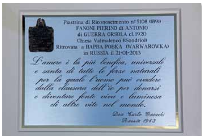
La bella targa dov'è collocato il piastrino ritrovato nei pressi di Warwarowka.