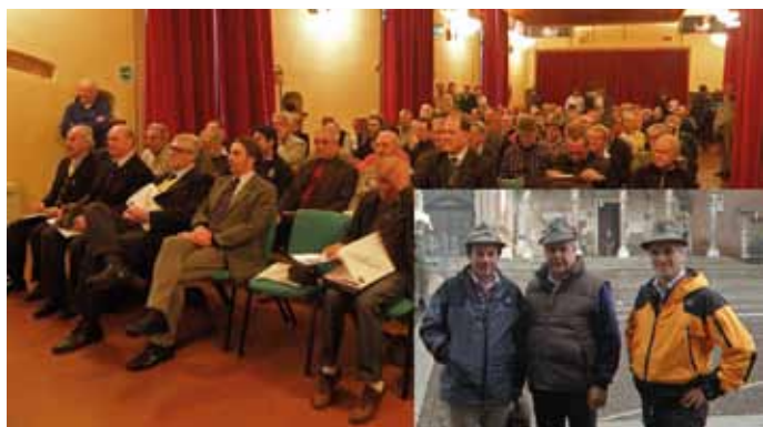
La riunione di Cremona con i vertici dello sport ANA.

Per quanto riguarda lo sci alpinismo viene ribadito quanto proposto dai responsabili della nostra sezione alla Commissione nella visita a Lanzada il 18/10/2013 e cioè dividere le coppie partecipanti in due categorie su due percorsi per soddisfare le esigenze degli atleti più anziani, tale proposta è messa ai voti seduta stante ed approvata all'unanimità dai presenti. I responsabili dell'organizzazione dei prossimi campionati nazionali di sci alpinismo (Sezione Valtellinese-Gruppo alpini Lanzada) dovranno predisporre il nuovo regolamento ed inviarlo alla Commissione Sportiva Nazionale per l'approvazione. La riunione è poi continuata nella presentazione da parte delle sezioni candidate ad organizzare i Campionati Nazionali ANA 2014: