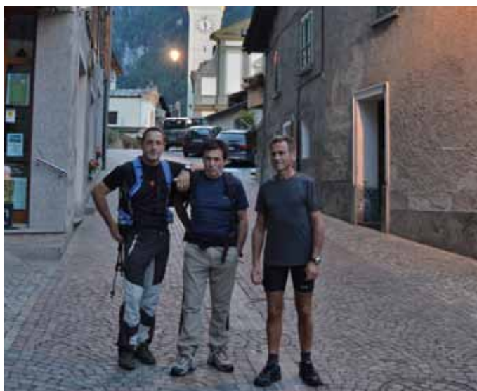
La cerimonia ed i protagonisti saliti a piedi da Lanzada.