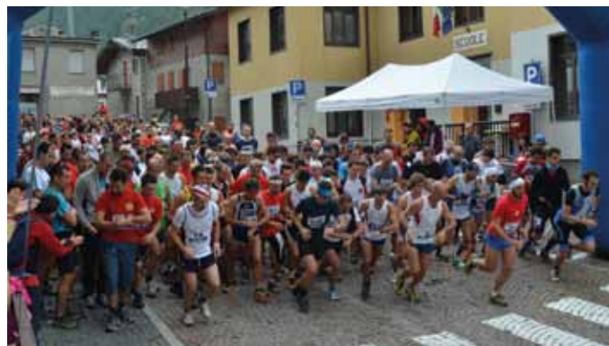
Significativa prova la "Scarponata Alpina" tesa a cementare Gruppi Alpini e comunità malenche, sport e territorio nel segno di una diffusa collaborazione tra Associazioni e cittadini.